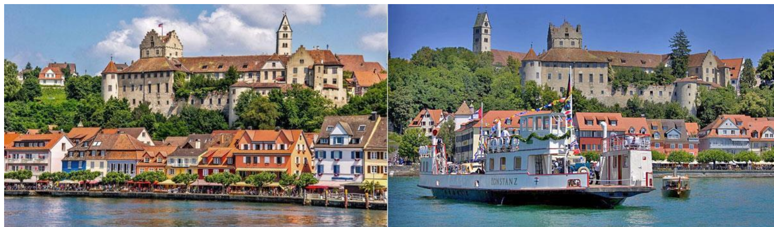
Alte Burg de Meersburg

Arrivée à Konstanz à 17h58 et transfert à notre hôtel. Installation à l'hôtel Halm Konstanz situé au cœur de la ville historique.