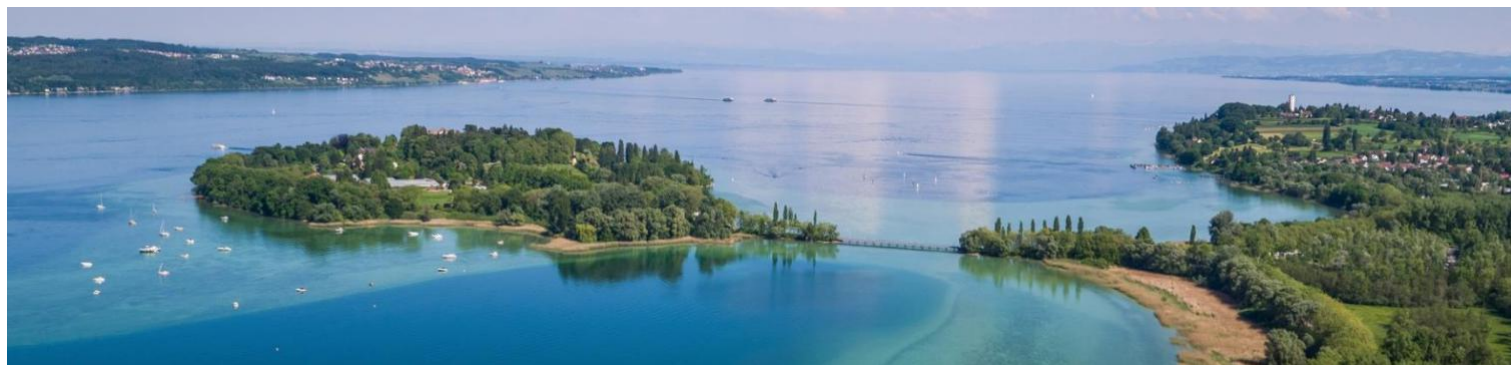
Célèbres jardins de l'île fleurie de Mainau